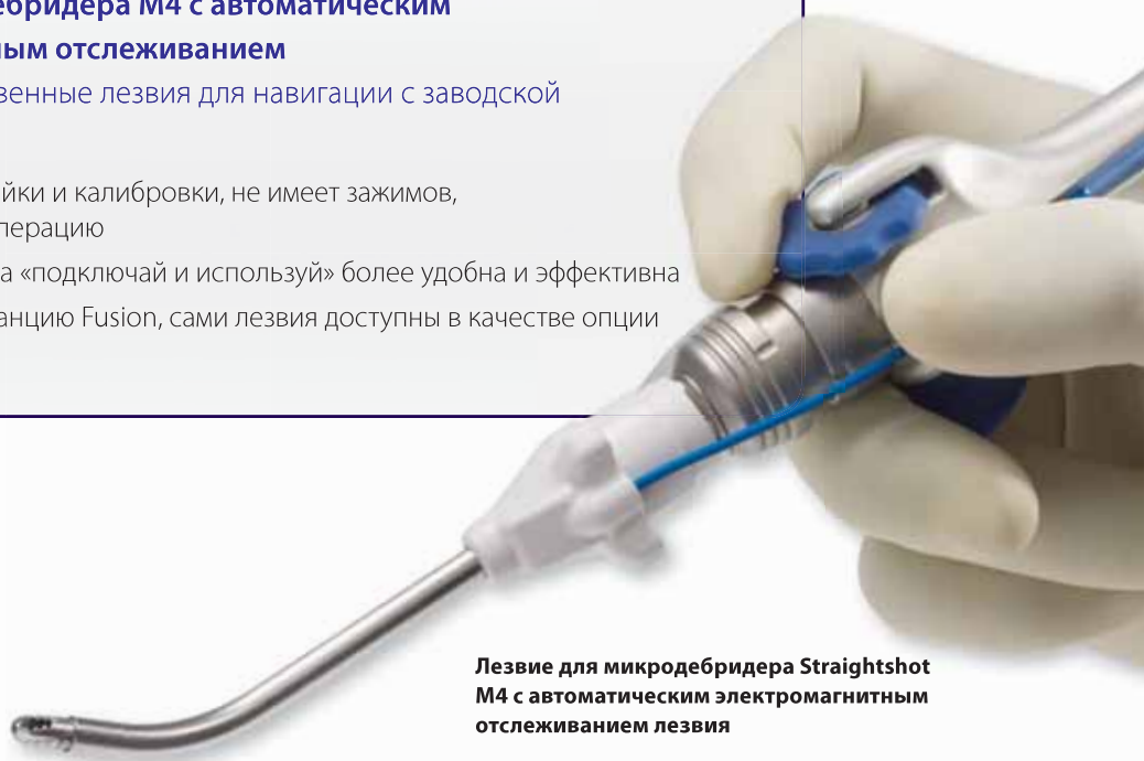
Лезвие для микродебридера Straightshot М4 с автоматическим электромагнитным отслеживанием лезвия