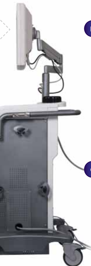
Навигационная станция для оториноларингологии Fusion® (вид сбоку)